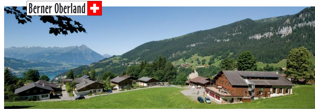
Jugendhaus Ramsern Waldegg Beatenberg